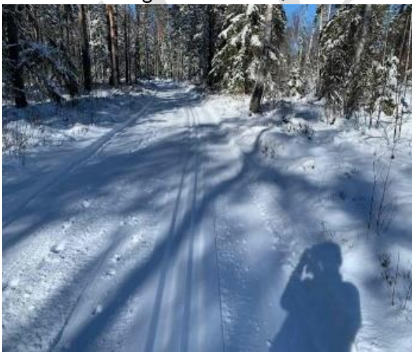
Bild från elljusspåret 8 mars 2023