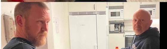
Årliga julbordet som knytkalas