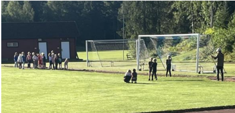
Idrottslektion i september

Lekerydsskolan har haft idrottslektioner på idrottsplatsen under april till oktober.