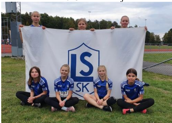
F13-laget under tävling i Ljunby