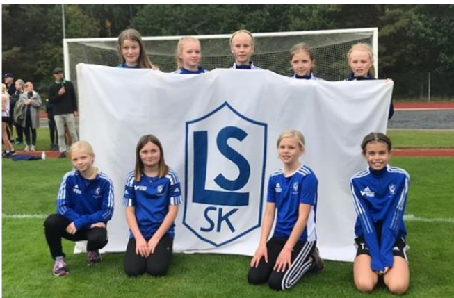
Klubblagsmatch för tjejer 11/9 på Råslätts IP

Nu ser vi fram emot 2022 när restriktionerna äntligen har släppt!