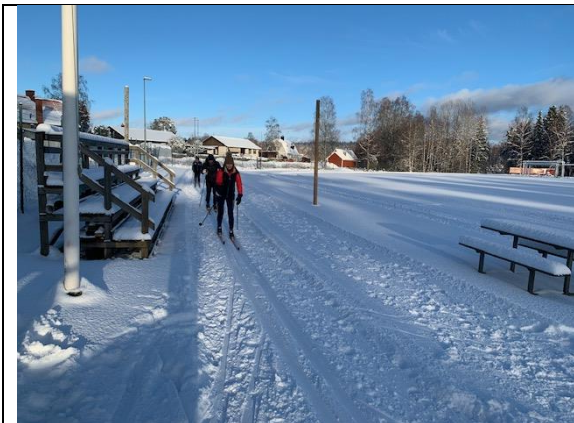
Furuvi 31 januari 2021

Träningsbanor på Lekerydskartan har lagts både vår och höst. Även i år fanns det "Hitta ut" kontroller i Lekeryd. Lörd. 7/8 augusti släpptes 15 nya checkpoints vid Uddebobadet som fram till oktober blev besökta av flera hundra motionsorienterare. En ny Sprintkarta har kommit till under året och den 26/8 genomfördes Södra Vätterbygsmästerskapen på densamma med 139 deltagare.