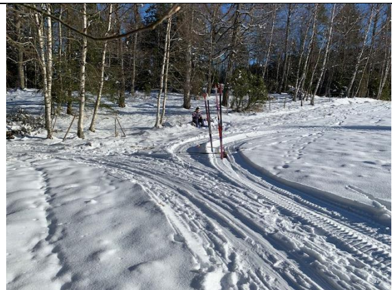
Vikspåret 13 februari 2021