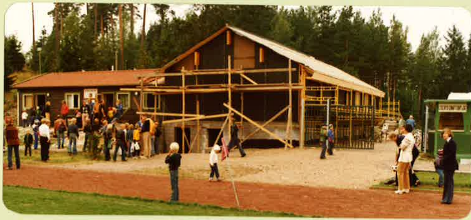
Klubb stugan under uppförande under 1978